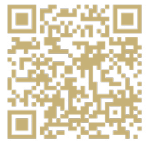
Escanea el código QR para ver la historia de Alex.

También se dedicó tiempo a la adoración y la oración. Juntos, los misioneros compartieron una epifanía: viajar lejos de casa los acercó aún más a Dios. Un ejemplo profundo de esto ocurrió durante la reflexión silenciosa cuando un misionero recibió su llamado de Dios. Actualmente se encuentra en el seminario discerniendo el sacerdocio. ¡Misión cumplida de muchas maneras inesperadas y milagrosas!